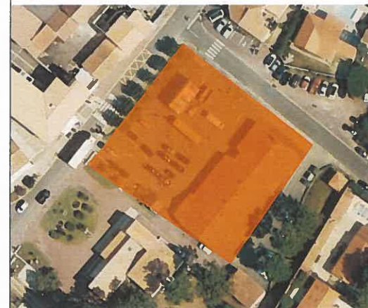
Supermarché – ZA 159 et 160