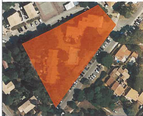
Dune de l'épinette – ZA 37