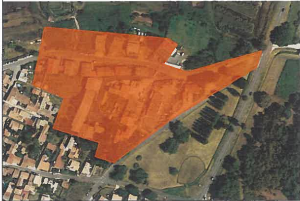
Zone artisanale – parcelles multiples