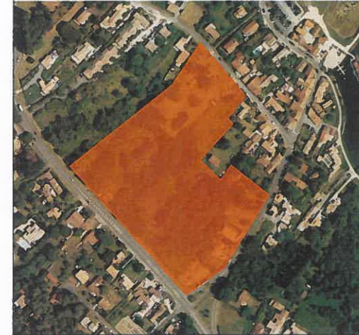
ZAC Les Déserts – Parcelles multiples