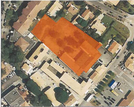
Groupe scolaire – ZA 167