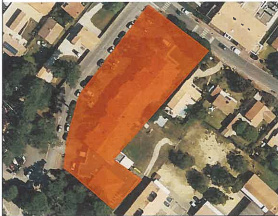
Maison de retraite – ZA 146 et 87